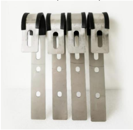
Haken 01 (4 Stück):