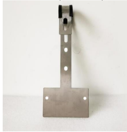
Haken 02 (1 Stück)